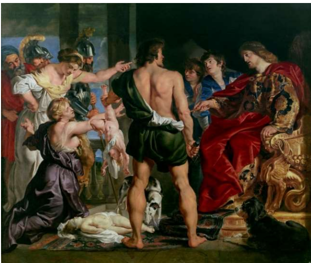
Peter Paul Rubens, Het oordeel van Salomo (1611-1614, Museo del Prado)